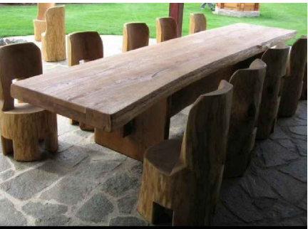
MASIVNÍ STŮL SE ŠPALKY NA SEZENÍ

ATYPICKÁ KLOUZAČKA - nerezová, š. 600mm - dodáno s kotevními, klempířskými a tmelícími prostředky